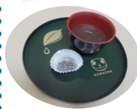
ぜんざいと塩こんぶ