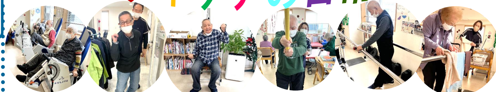
津森デイケアに来られている利用者様はほんとに皆さん意欲的にリハビリに取り組まれています。