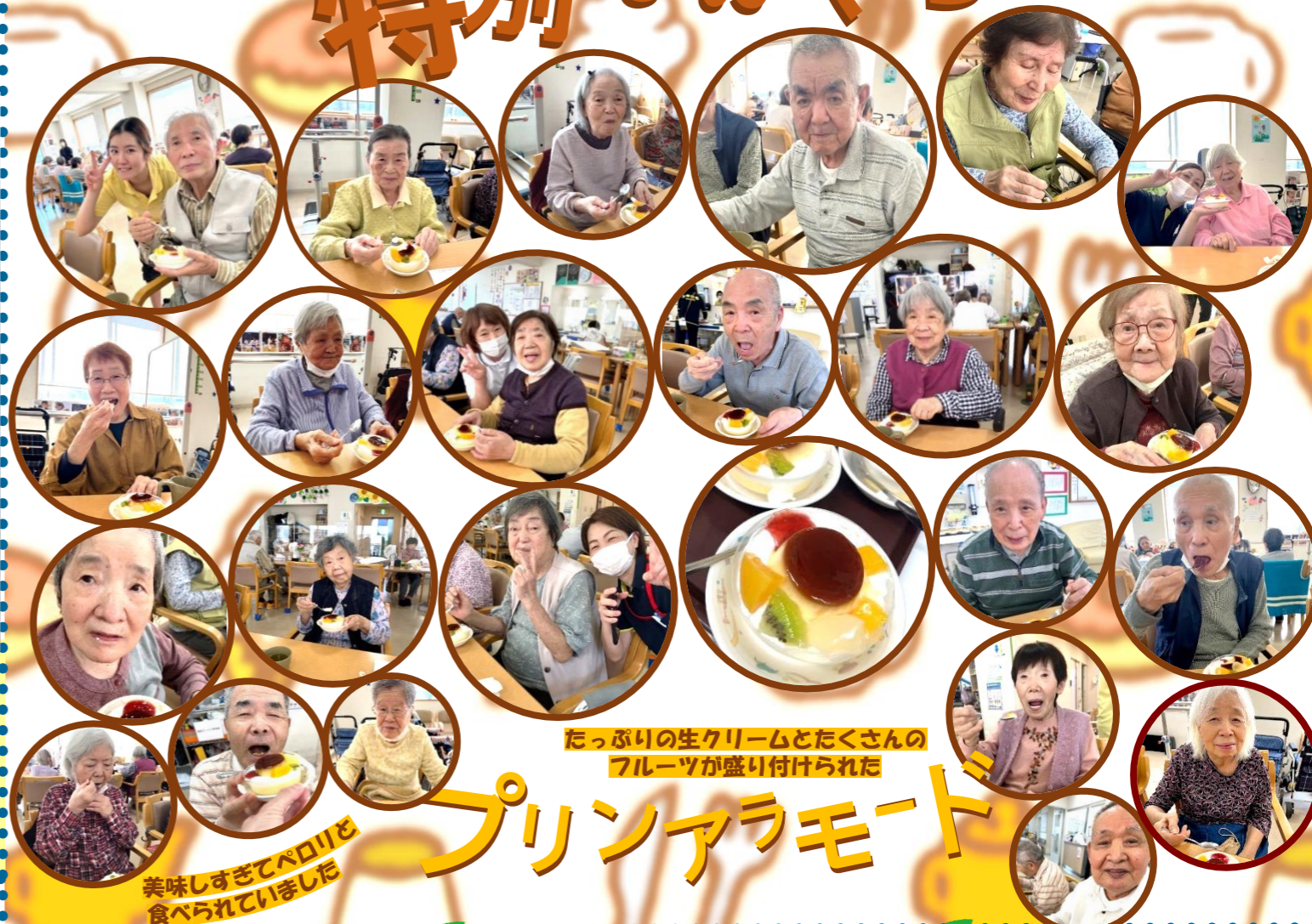
たっぷりの生クリームとたくさんの フルーツが盛り付けられた