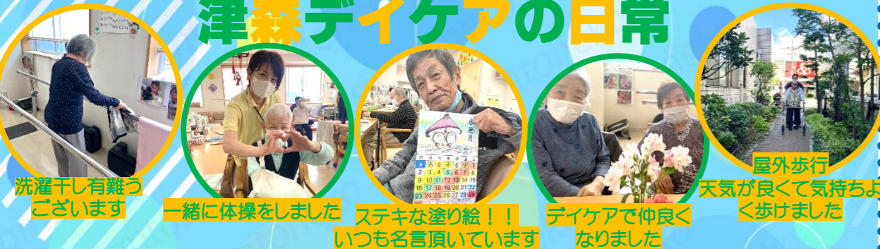
洗濯干し有難う ございます